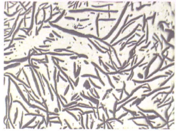
图2 床身的金相组织（珠光体+A型石墨）×100

经粗加工检验，床身的几何尺寸与加工余量均达到图样要求。然而由于在床身生产初期对树脂砂发气量大，机床类铸件易出现导轨面气孔缺陷的认识不够，生产过程未能及时监控型砂中的树脂含量，以及原砂加入量不稳定等因素，造成树脂实际加入量高达3.0%以